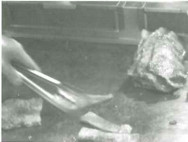
▲宮崎牛の鉄板焼き