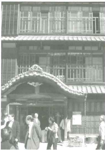
◀日向市畑島みなと資料館

紙面の関係上詳細に報告出来ないのが残念であるが、10年の交流会を顧みると、地方の行政財界の方々が私達に寄せる活性化への期待は強力なものがあります。お互い知恵を出し合って実現したい。今後も皆さんの絶大なご協力、ご参加をお願い致します。