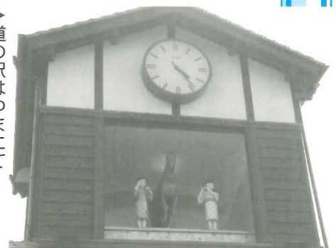
▶道の駅はゆまにて