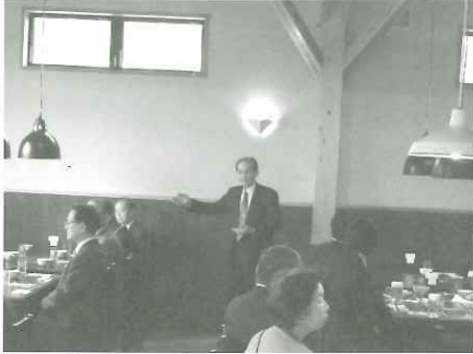
▶がまだせ市場昼食会▶