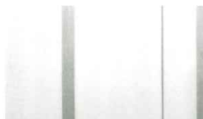
▲高山会長開会の挨拶