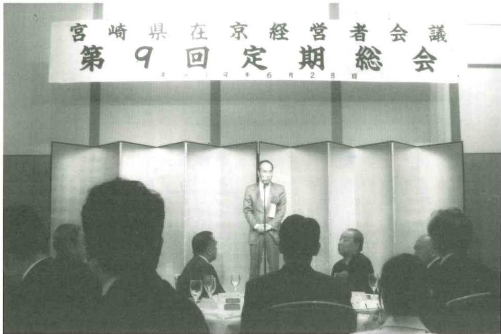
▲東国原知事のご挨拶

6月28日(木)千代田区のグランドアーク半蔵門で、第9回定期総会が開催された。総会は、議案書に基づき進行され、平成18年度事業報告並びに収支決算の承認がなされ、続いて平成19年度事業計画並びに収支予算案についても