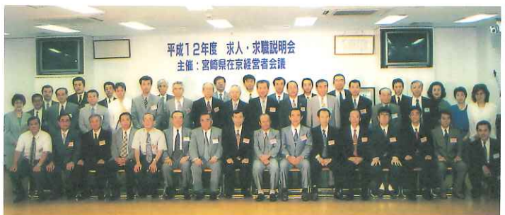
▲第1回「求人・求職説明会」

宮崎県内学校(高校・短大・大学)の首都圏就職希望者を支援するために在京経営者会議会員企業と県内学校担当者との就職支援説明会が開催されました(平成12年7月・ハリウツド美容専門学校)。おかげさまで、会員の皆様のご協力を得て6名の内定者を見ることができました。