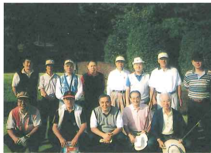
▲第1回「宮崎フェニックス会」

ゴルフ同好会が昨年9月に「会員相互の親睦を図り、心安らぐ楽しみのある会」をモットーとして発足した。会の名称も「宮崎フェニックス会」となりさっそく活動として 第1回 10月16日 府中カントリークラブ 第2回 12月6日 多摩カントリークラブ にて多数の参加者のもとに盛大に開催されました。本年度も企画満載で楽しく