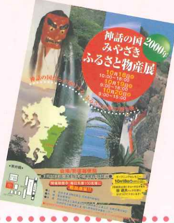
みやざきふるさと展のチラシ

ふるさと物産展は、地域の振興及び情報発信の支援を図るため、地方自治体と郵便局が連携し、新宿局において平成2年度から実施している。この物産展は、地元の物産や観光をPRしたいという自治体と郵便商品のPRをしたいという郵便局のニーズがマッチして取り組んでいる施策で、具体的には次のような取り組みを行っている。