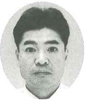
(株)パフーステーション 代表取締役社長

昭和29年3月に上京し、現在南森経営相談所と、森会計を経営しております。よろしくお願ひ致します。