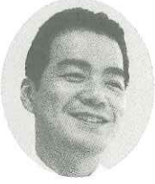
(株)オーキッドスタイル 代表取締役

何があんなか世の中がわからず走り、気がついたら上京し47年になつていました。今後の人生は社会に役立つ生き方をしたいと思つています。