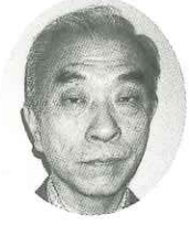
(株)創造経営センター 主任経営コンサルタント

はじめまして。当社は常に創造改革を実践し、業界のリーダーカンパニーとして強い企業を目指しています。