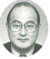
旭化成ネットワークス(株) 代表取締役社長

大宮育ちで生まれ、全ての生命のついでに、森川川自然が癒やされて来た人間がうあまか、人として精神を高めるに何をすればいいのか、その念の心の確立を目指しています。