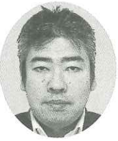
(株)オプサイブ 代表取締役

1946年延岡高校卒、1969年京都大学卒。三井物産では石油化学関係の営業に32年間従事、直近の4年は本店の総務部に所属。