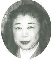
画塾玄の会・虹色空間 教室経営公募日本表現派同人委員

宮崎県経営者会議に入会させて頂き、ふるさとの皆様と交流でき、毎日の活動に大変役立てており、感謝致しております。