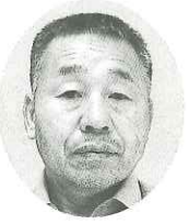
フジケミカル(株) 代表取締役