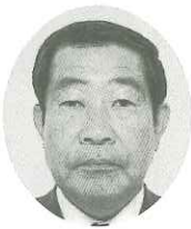
三井物産(株) 理事・人事総務部

「童心」の言葉が私は好きです。感性を育んでくれた故郷に感謝！これからも皆様と共に郷土愛を深めたく存じます。