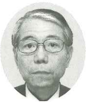
(株)アルファ・キューブ 取締役副社長

1度宮崎に戻りましたが、昨年また東京に戻つてきました。現在、新しい胡蝶蘭のスタイルをつくるという事に挑戦しています。よろしくお願ひいたします。