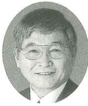
世田谷の明日を拓く会 会長