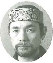
ニシムラ・スタジオ 写真家