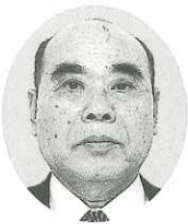
(有)森経営相談所 森会計 代表取締役 税理士

宮崎県に関わりを持ってから30年、弊社はまだ1年目の新しい会社です。データセンターを利用下さい。よろしくお願ひいたします。