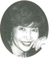
クリーニング工房ブラン 営業企画

弊社は、7年前にフット・EIT関連事業を核として起業いたしました。故郷に恩返しできればと思つております。よろしくお願ひ致します。