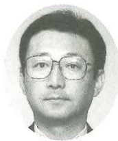
(株)毎日新聞社 不動産本部次長

社会人になって35年になりましたが、今までの経験を生かして宮崎に貢献できるように頑張ります。