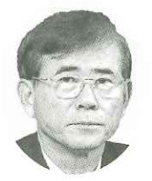
(株)ヤマダ電機 代表取締役社長兼CEO

自然豊かな古里を思う時、出身地の事を誇らしく思ひます。何かお役に立つ事で古里を身近に感じていたいです。